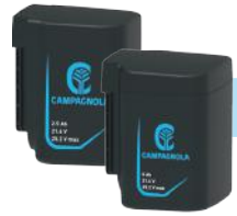
BATERÍAS ENCHUFABLES 21,6 V