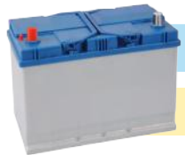
BATERÍA DE PLOMO 12 V